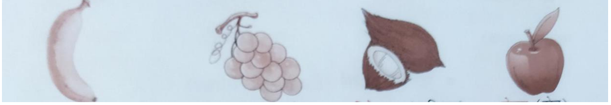
कदलीफलम् (केला) द्राक्षाफलम् (अंगूर) नारिकेलम् (नारियल) सेबम् (सेब)