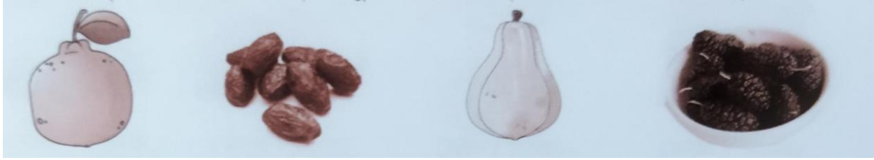
नारङ्ग (संतरा) खर्बूजम् (खजूर) पपीतकम् (पपीता) तूतम् (शहतूत)